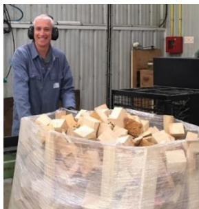
N°1. Les plots