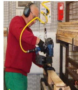
N°4. Les semelles