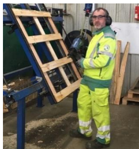
N°2. Le plateau