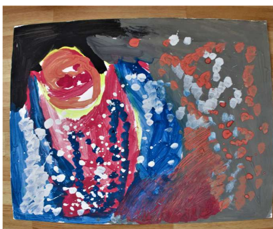
"Le Bonhomme de neige qui siffle"