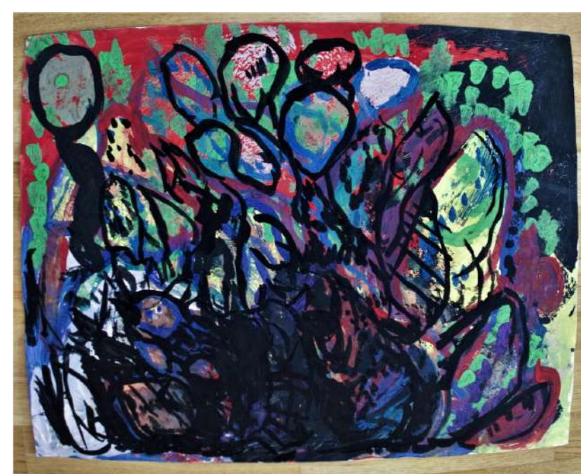
"Cueillette dans la nature"