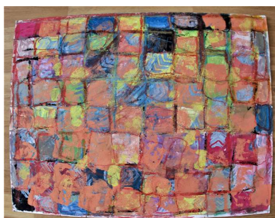
"Les petits carrés de couleurs"