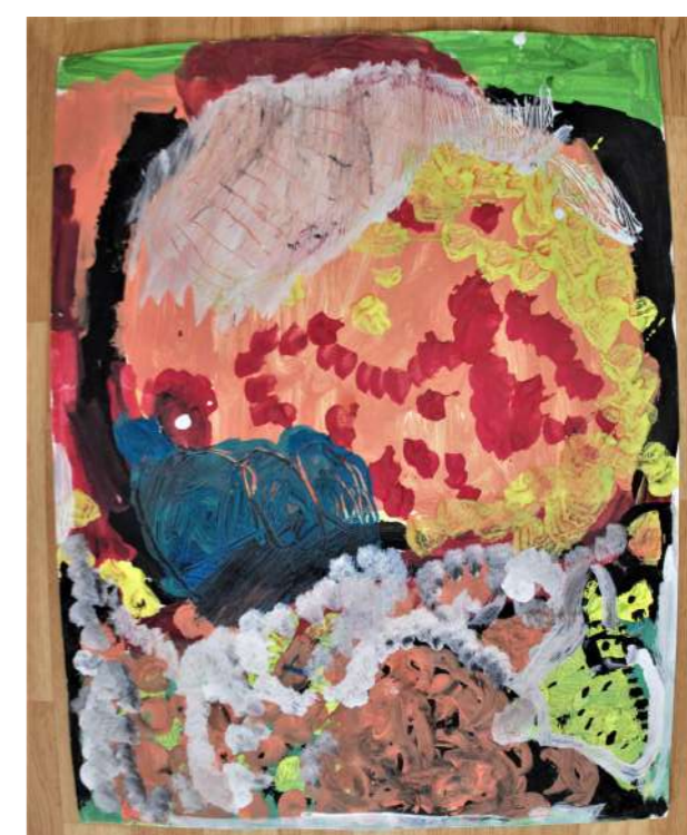
"La grande poule avec ses poussins"

Le mot de l'Artiste "Je suis contente pour faire un petit journal avec Lisa et je suis heureuse de montrer mes peintures pour toutes les équipes!"