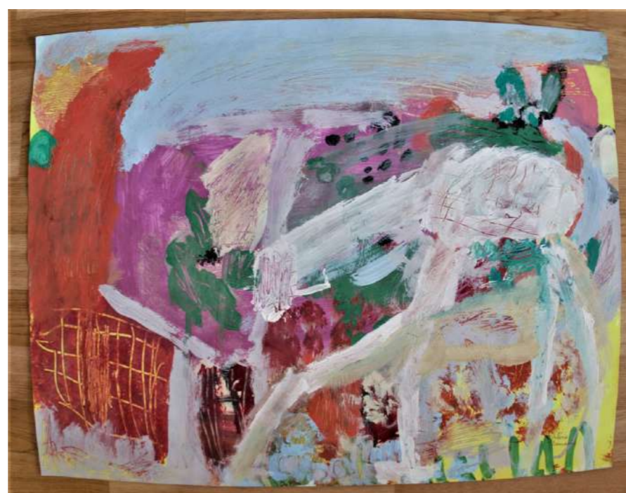
"L'oeuvre sans nom"