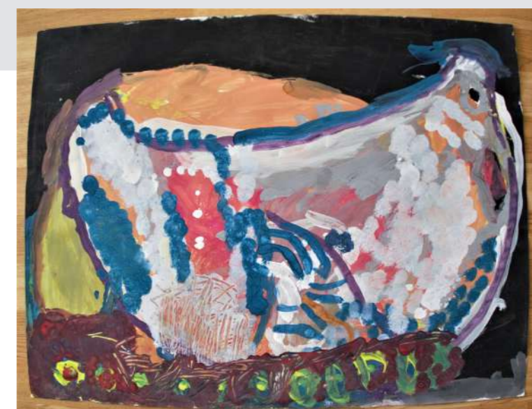
"La poule et ses poussins"