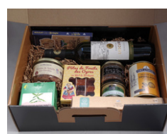
Valisette - Grande