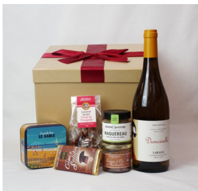
Boite carton - Ruban rouge - 27x27x22