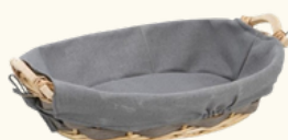
8200 Corbeille ovale osier 37x29x10 cm 5.85 HT - 7.02 TTC

Si les valisettes et la pochette ne vous conviennent pas, ce coût supplémentaire est à rajouter pour les contenants proposés ci-dessous.