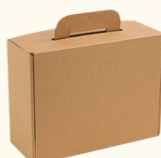
8101 Valisette - Moyenne - 34.5x22x12