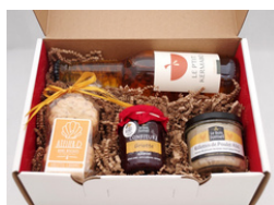
Valisette - Petite

Exemples de contenus dans chaque valisette suivant les différentes tailles