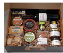
Valisette - Très grande

Si les valisettes et la pochette ne vous conviennent pas, ce coût supplémentaire est à rajouter pour les contenants proposés ci-dessous.