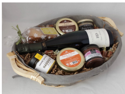
Corbeille ovale osier - tissu gris - 37x29x10