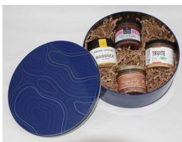
Boite ronde métal - Diam 19.5 cm