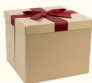
8206 Boite ruban rouge 27x27x22 cm 6.20 HT - 7.44 TTC