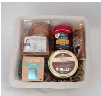
Corbeille osier - Tissu beige - 22x22x9