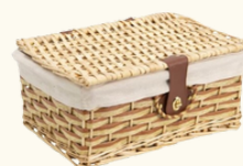
8209 Valise en bois naturel 40x30x18 cm 22.75 HT - 27.30 TTC