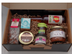
Valisette - Moyenne