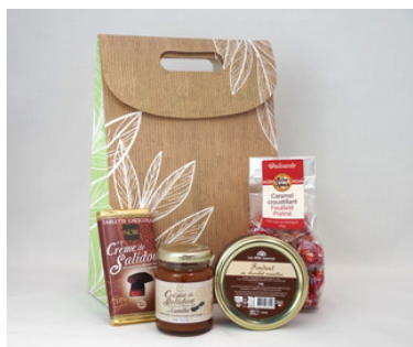
Pochette cadeau kraft et vert - 27x19x9