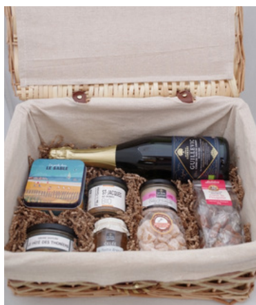
Valise en bois naturel - 40x30x18