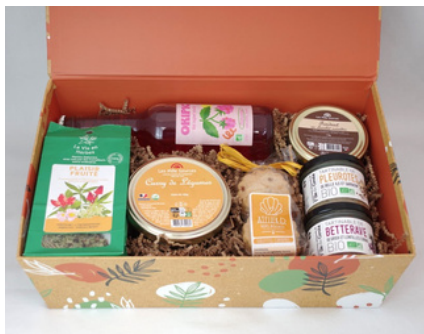
Boite rectangulaire orange - 35x23x11

Des compositions tout au long de l'année, prêtes à être livrées. Pour tous les budgets.