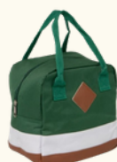
8205 Valisette Isotherme 22x15x22 cm 4.95 HT - 5.94 TTC