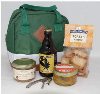
Valisette Isotherme - 6L - 22x15x22