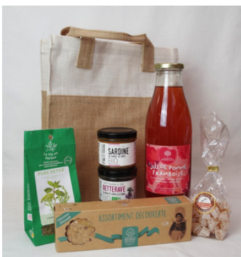
Sac en jute naturel et blanc - 27x18x33