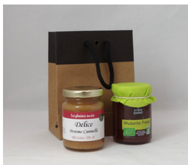
Pochette cadeau chic bicolore - 14,6x11,4x6,4