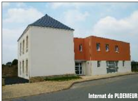
Internat de PLOEMEUR

Nous avons heureusement quelques satisfactions, par exemple la mise en place du Sessad à Belle-île, avec la spécificité insulaire qui nécessitera un temps d'acclimatation avant de devenir complètement opérationnel. C'est aussi la mise en place de l'internat de Ploemeur dans ses