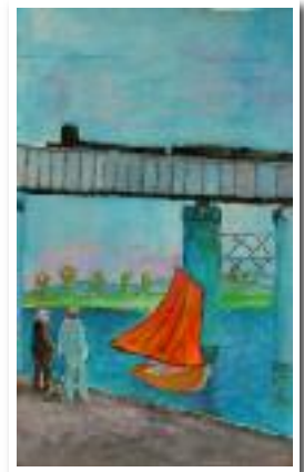
Ballade au bord de l'eau