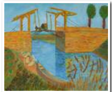
Le pont transbordeur