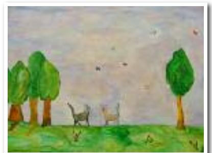
Contes et légendes